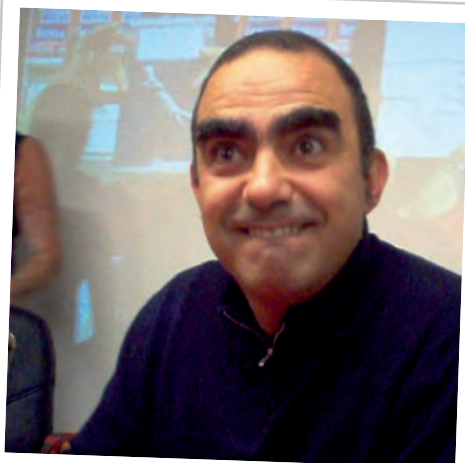
Elio e le storie tese